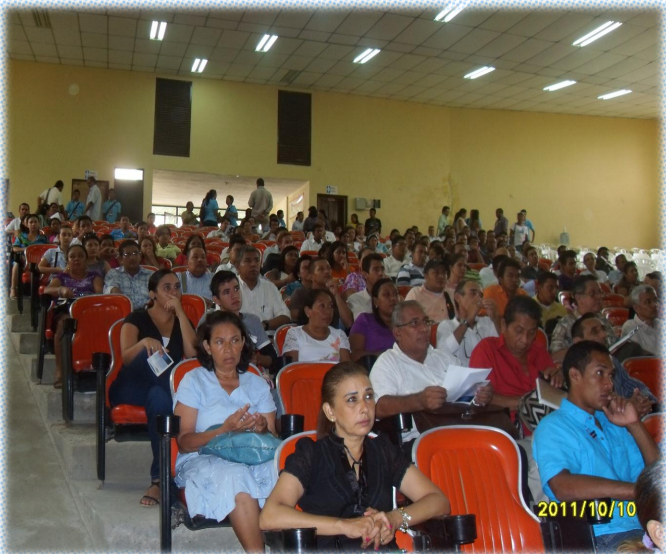
Asistentes a Primera Cumbre Internacional de Liderazgo