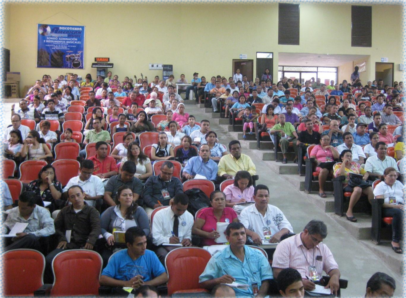
Al fondo, Stand de AMERICAN MUSIC, patrocinador de este evento