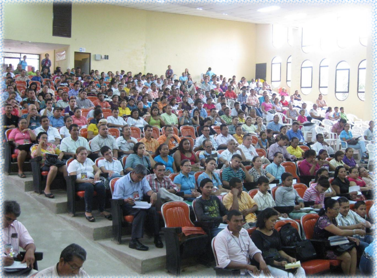
Asistentes en segundo día de Cumbre