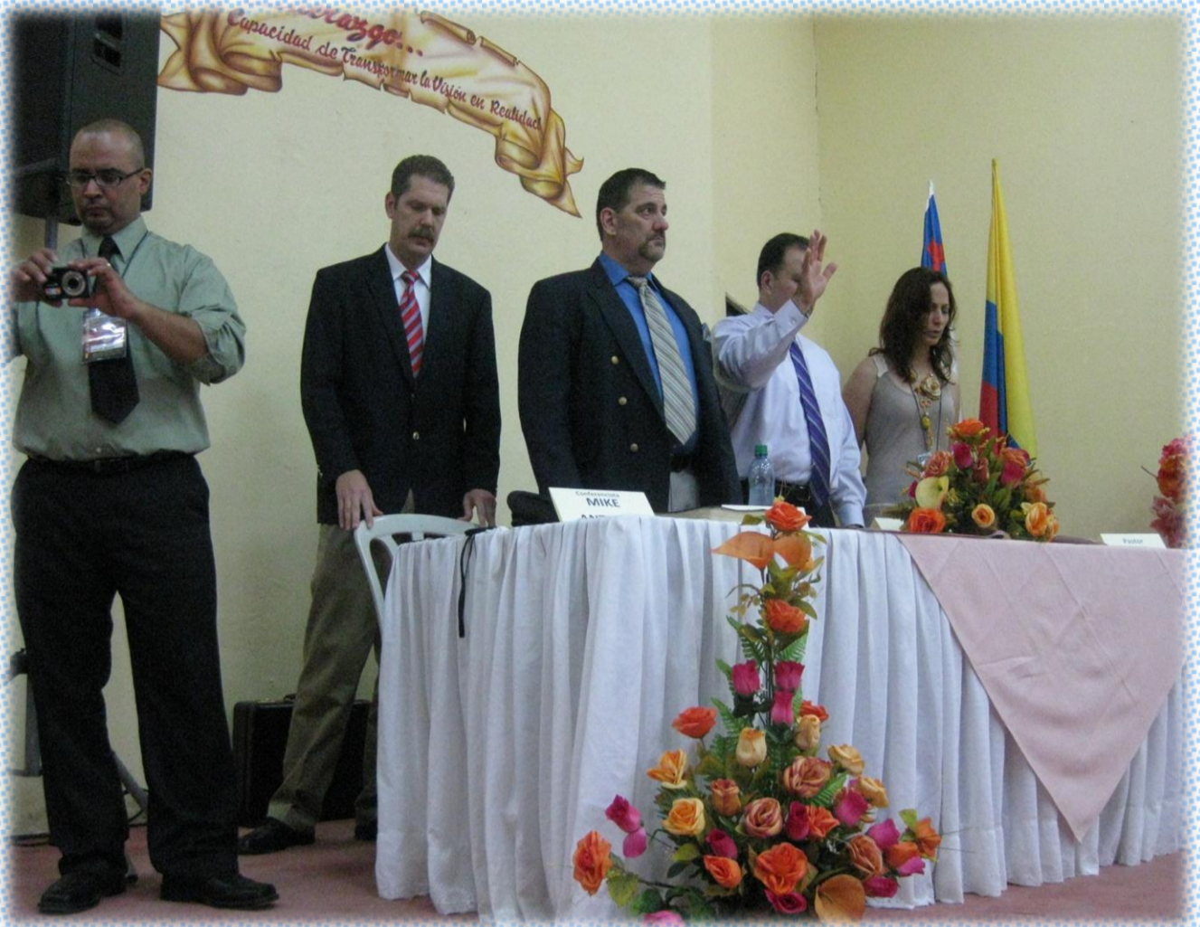
Ponentes de Primera Cumbre Internacional de Liderazgo, orando para iniciar el tercer día del evento