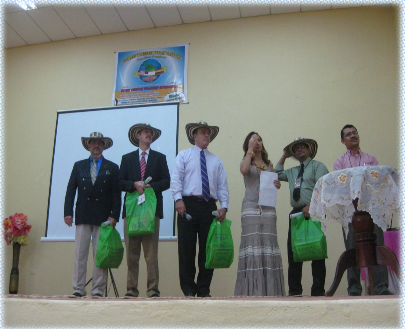
Recibiendo el recuerdo de nuestra bella tierra, sombreros vueltiaos