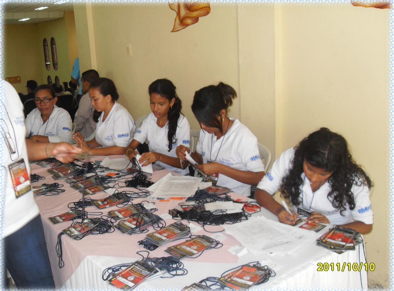
Comité de Recepción.