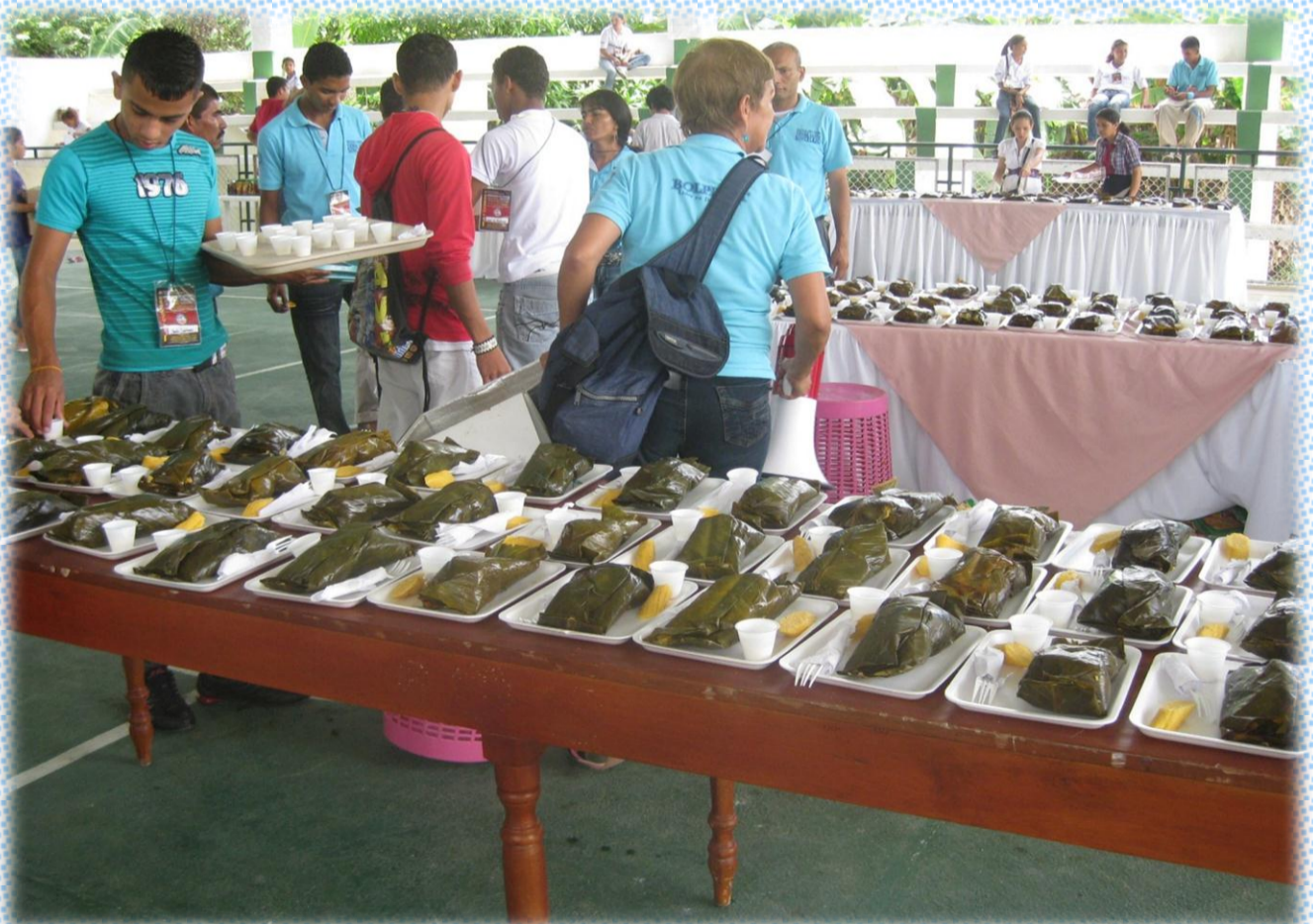
El almuerzo del día final de la Cumbre, delicioso